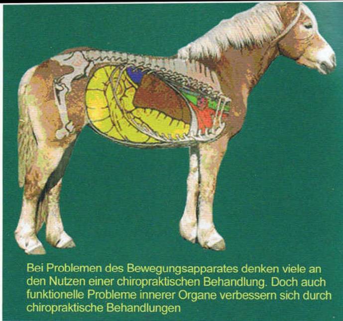
Bei Problemen des Bewegungsapparates denken viele an den Nutzen einer chiropraktischen Behandlung. Doch auch funktionelle Probleme innerer Organe verbessern sich durch chiropraktische Behandlungen

Das Pferd hat vielleicht als Symptome Taktunreinheit im Trab und kolikartiges Verhalten nach dem