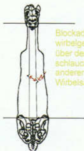
Blockaden der Zwischenwirbelgelenke verursachen über den Zug am Hirnhautschlauch Blockaden an anderen Stellen der Wirbelsäule.

Zwischen diesen beiden festen Anheftungsstellen verläuft die harte Hirnhaut unbefestigt und beweglich wie ein Schlauch frei entlang des gesamten Wirbelkanals. Nur so ist spannungsfreie Beweglichkeit der